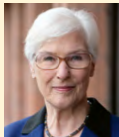
Dr. Irmgard Schwaetzer Präses der Synode der Evangelischen Kirche in Deutschland

Die Coronakrise hat unser Leben stark verändert. Neben dem Bangen um die Gesundheit der uns nahestehenden Menschen, neben der Sorge um die wirtschaftliche Entwicklung und neben vielen Einschränkungen, enthält die Krise auch Chancen zum Perspektivwechsel und zur Umkehr: Wollen wir so weitermachen wie vor der Pandemie? Geht es nicht auch mit weniger Konsum, weniger Ressourcenverbrauch, weniger Abfall, weniger oder anderer Mobilität? Brauchen wir nicht stattdessen mehr Fähigkeit zur Begrenzung, Entschleunigung, Solidarität und Achtsamkeit?