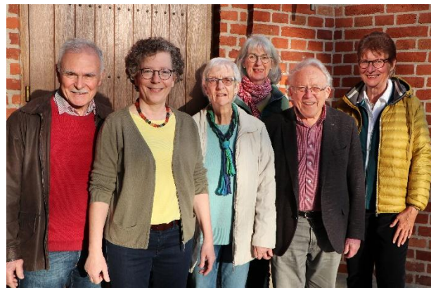
Team „Orte des Zuhörens“

Mail an: OrteDesZuhorens-GKG.Kirchheim@drs.de